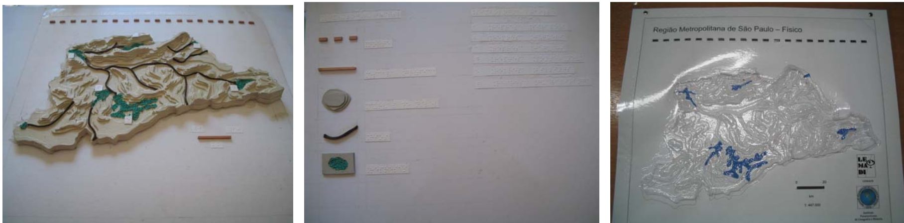
Figura 1: Região Metropolitana de São Paulo – Físico - exemplo de material elaborado durante o projeto (matriz e cópia em thermoform)