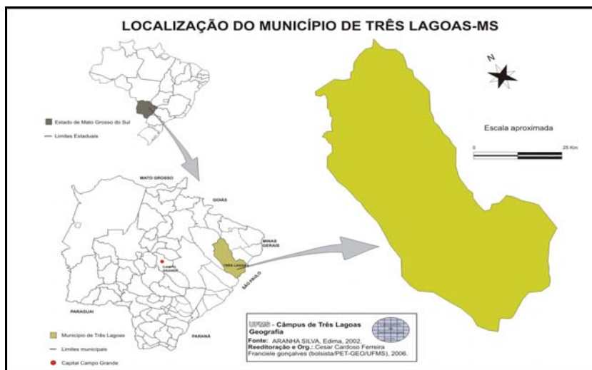
Figura 1: Localização de Três Lagoas em Mato Grosso do Sul – Brasil

O município de Três Lagoas, segundo IBGE (2009) se localiza no Estado do Mato Grosso do Sul na região leste do estado entre as coordenadas 20° 45' 04"S e 51° 40' 42"W, conta 90 mil habitantes. Sua economia foi baseada na pecuária até 1997, quando através de incentivos fiscais e sua localização estratégica na divisa com o estado de São Paulo, o sistema de transporte multimodal viabilizado pela BR-262, a ferrovia América Latina Logística e navegação fluvial Tietê-Paraná, têm motivado diversas indústrias. A abundância de energia elétrica e facilidade para contratação de mão-de-obra disponível ou oriunda de outras regiões facilitaram a consolidação de um pólo industrial sul-mato-grossense.