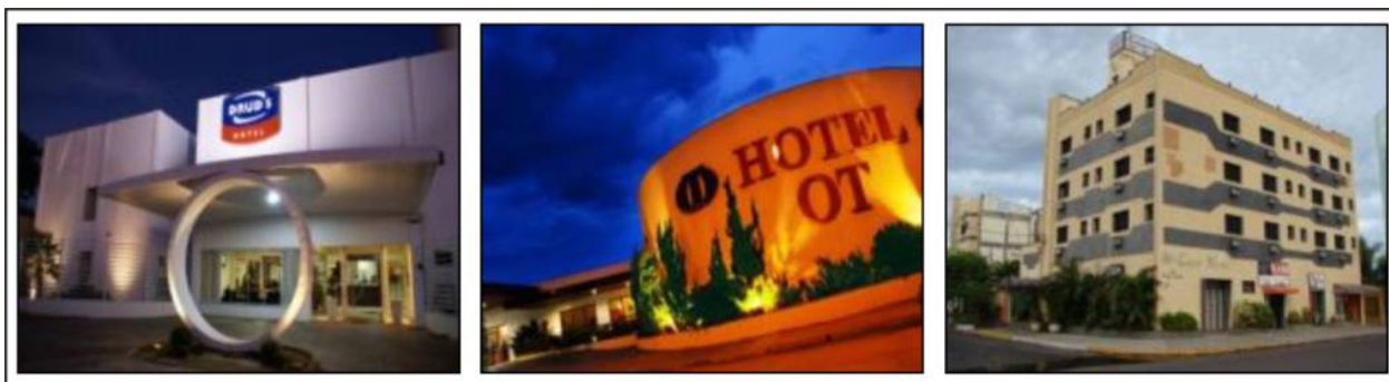
Figura 3: Hotéis em Três Lagoas-MS.

Quanto à estrutura e instalações físicas constatou-se diferenciação entre os empreendimentos, pois se registrou que poucos hotéis possuem cofre, salas de jogos, piscina, sauna, sala de convenções e restaurante, sendo que estes requisitos são encontrados nos 4 maiores hotéis, conforme Quadro 1.