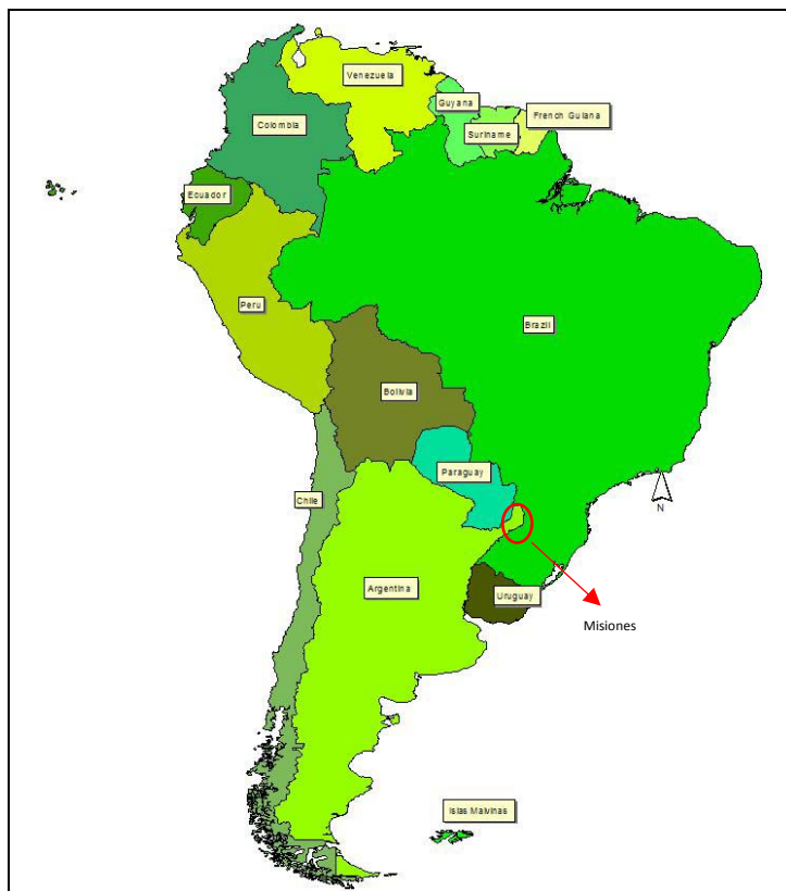
Mapa 1: Localización de la provincia de Misiones en Argentina, América del Sur