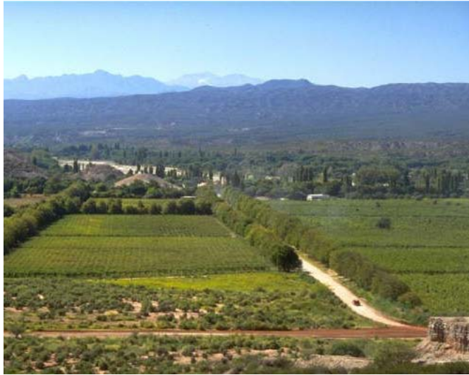
Foto 5: vista panorámica de la zona sur de la Localidad de Hualfín.