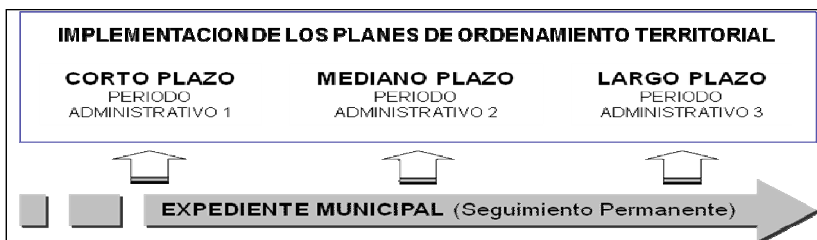
Figura 2. Relación entre la temporalidad de los POT y el Expediente municipal.

sino a la realización de una revisión crítica del P.O.T, en la marcha de su aplicación; además de la identificación de las vías para llegar a la visión y el modelo de ocupación territorial, que se quiere para el municipio. Por lo tanto, como lo expone el Ministerio de Ambiente, Vivienda y Desarrollo Territorial “la revisión no debe entenderse como una disculpa para promover un nuevo Plan de Ordenamiento, sino como el espacio estratégico por excelencia para mejorar y corregir las anomalías e irregularidades identificadas en el Plan vigente, e introducir elementos de ley faltantes en el mismo que permitan la construcción real del modelo municipal, logrando así optimizar los beneficios que se obtienen de la planificación a largo plazo” 8 . La figura 2, muestra la relación entre la temporalidad del Plan de Ordenamiento Territorial y el Expediente Municipal.