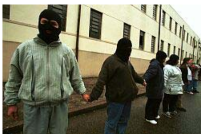
Policiais encapuzados fizeram uma corrente em frente ao quartel nesta manhã.

Depois de 10 dias acampadas em Curitiba, o último dia de manifestações foi marcado pela incerteza, boataria, barulho e até espionagem. Cerca de 70 policiais militares encapuzados aderiram ao movimento de mulheres para garantir a segurança delas. Eles participariam da passeata até o Palácio Iguazu, que acabou por ser cancelada. Contudo, a promessa dos PMs intitulados "Abandonados pelo Governo" de recolher as viaturas por 24 horas nos quartéis não foi cumprida. "Não houve grande adesão dos PMs porque o governo ordenou que os policiais que estivessem de folga ficassem aquartelados ou fizessem hora-extra nos presídios", justificou um policial encapuzado. A notícia que passou a circular entre os manifestantes era de que, saindo de frente do Quartel General em passeata, os encapuzados seriam presos. Sentindo-se ameaçados pelos boatos, junto com as mulheres, apoiados por um caminhão de som, formaram uma espécie de corrente humana em volta do Quartel, gritando palavras de ordem e promovendo um apitaco . As sirenes de algumas viaturas que estavam com os pneus murchos foram ligadas. No final, em meio ao choro de várias mulheres, todos cantaram o Hino Nacional e rezaram. 32