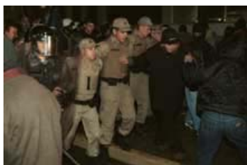
Manifestantes são retiradas por policiais femininas da entrada do Quartel Geral da PM.

No início da desocupação, as mulheres deram as mãos e rezaram. Depois, elas pediram aos policiais do Batalhão de Choque que se juntassem ao movimento. Como não houve adesão, a estratégia de algumas foi se deitar no chão para dificultar a retirada. Os policiais avançaram, alguns com armas em punho, para a Rua Getúlio Vargas, empurrando todos os que estavam à frente. Nenhum tiro foi disparado, mas a PM foi firme e rígida, com empurrões. Com um cordão humano fechando a extensão das duas pistas da Getúlio Vargas, empurrou pela via todas as pessoas que estavam entre a Marechal Floriano e a João Negrão. Algumas mulheres foram derrubadas, outras desmaiaram, mas os policiais colocaram os escudos à frente e continuaram a avançar. Outras chutaram as viaturas e tentaram agredir os policiais que cumpriam a ordem judicial. Muitas das manifestantes que se recusavam a deixar o local foram retiradas pelo contingente da Polícia Feminina, em viaturas da polícia. Revoltadas, algumas mulheres que se deitaram no chão também terminaram sendo arrastadas para dentro do camburão, chorando. 40