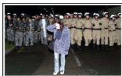
Mulheres não tiveram como resistir à ação policial de retirada.